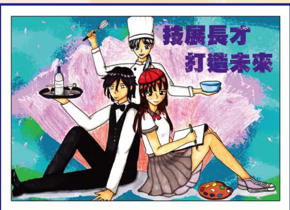
212 謝霏妍 | 技展長才

步入高中常常會迷失方向，不知道自己的選擇是否是對的，但每個職科都有它發光發亮的地方！不管你選擇哪個，途中遇到多少困難，那只是你變得更熟悉這個職科的過程，給自己更多自信，堅持自己的理想，你會找到這份美好。