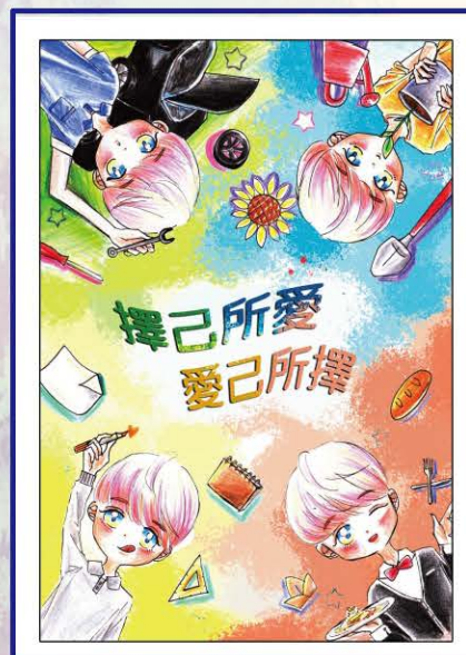
212 陳羽喆 | 愛你所選

畫面裡三個人的動作和鋼鐵人很像，是希望可以和他一樣堅強勇敢地完成夢想，在努力過後總有一道彩虹為自己綻放。