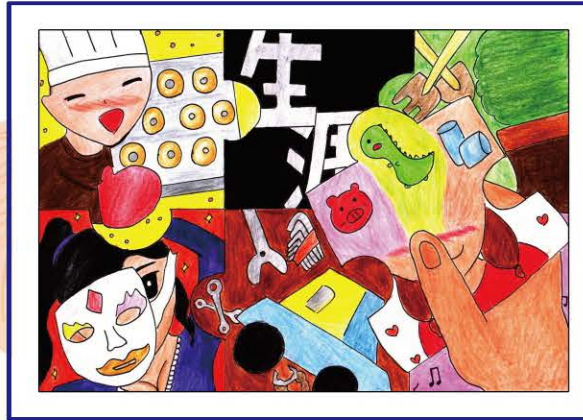
212 洪依萱 | 活出自己的模樣

用書中不同的職業介紹來更了解自己喜歡和適合的職業，或許可以在迷茫的未來找到屬於自己的道路。