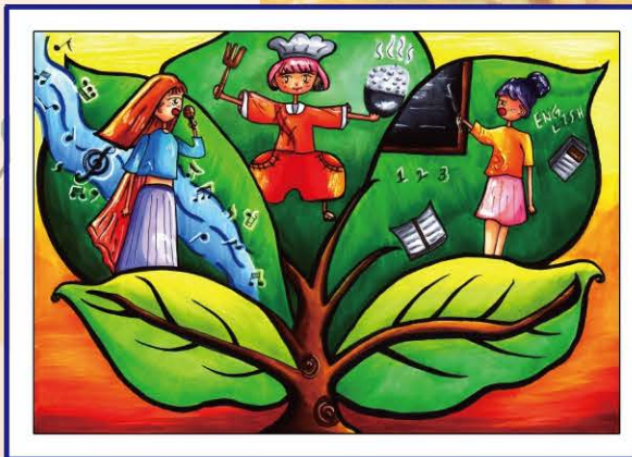
212 許瑋庭 | 生涯之樹

表現出每個人在選擇自己的職涯時的情景。圖中穿著校服的女學生遲疑地準備拿起鉛筆表示選擇職涯的不確定性，為了表現職涯不受性別刻板印象限制，將一般大眾所認知的工人調換成女性，且工人做工需要大量的體力，所以讓她抱著廚師辛辛苦苦的麵包，讓廚師看到覺得很訝異。