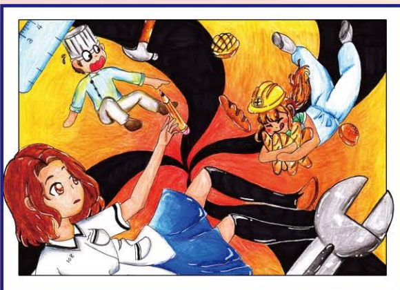
212 鍾琬育 | 職涯漩渦

人生就像一場盛大的冒險，現在的我們正拿著望遠鏡和藏寶圖在未來的汪洋中漂泊，尋找著名為「夢想」的寶藏。