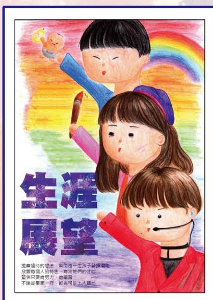
212 林芳妤 | 生涯展望

了解自己，享受當下，不必受限於人，各行各業，不分貴賤，喜歡什麼，那就勇敢去做吧，或許過程中挫折過，但相信自己，持續努力，一定會有收穫的。